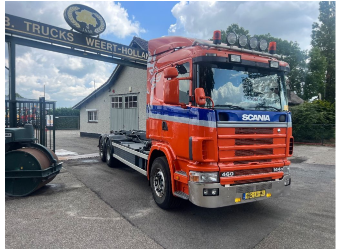
Scania V 8 144.460 MANUAL GEAR