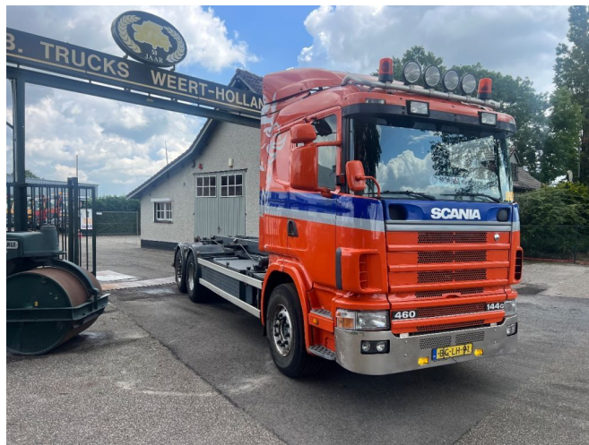
Scania V 8 144.460 MANUAL GEAR