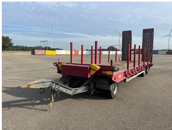
ATM 3 asser bladgeveerd