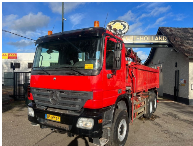
Mercedes-Benz Actros 3336 AK 6x6 Steel Springs CRANE TI...