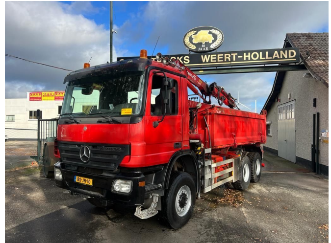
Mercedes-Benz Actros 3336 AK 6x6 Steel Springs CRANE TI...