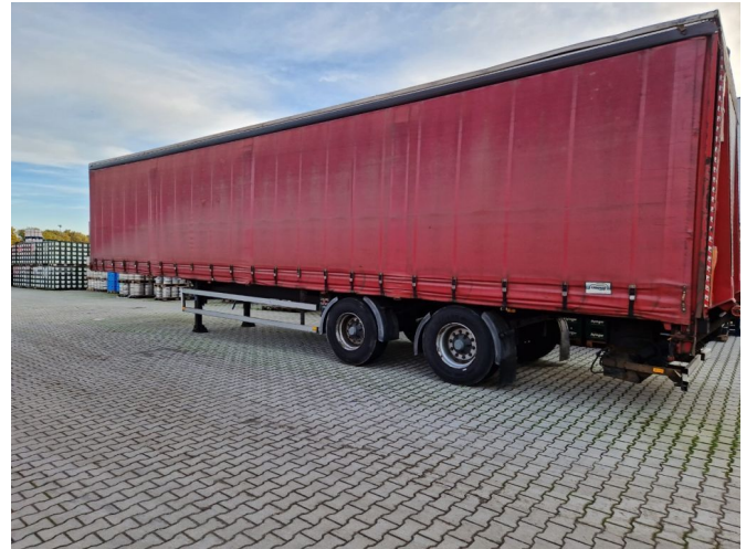
System Trailer 3 tonse laadklep schuifzeilen