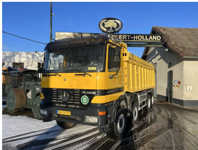
Mercedes-Benz Actros 4140 AK 8x8 Steel Springs - 3 pedals...