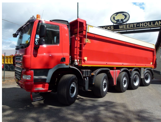
Ginaf X 5450 S - 10x8 - Asfaltkipper MANUAL GEAR