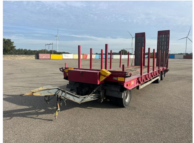
ATM 3 asser bladgeveerd