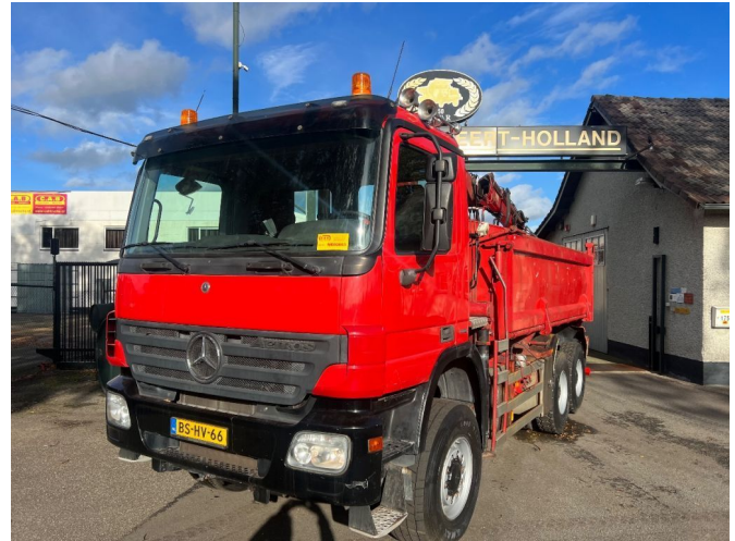
Mercedes-Benz Actros 3336 AK 6x6 Steel Springs CRANE TI...