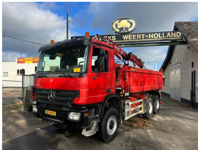
Mercedes-Benz Actros 3336 AK 6x6 Steel Springs CRANE TI...